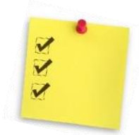
TABLEAU SYNTHÈSE FRAIS DU SERVICE DE GARDE